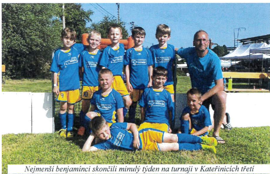
Nejmenší benjamínci skončili minulý týden na turnaji v Kateřinách třetí