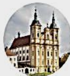
Poutní kostel Dub nad Moravou