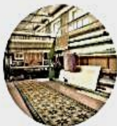
Gobelínka Valešské Meziříčí