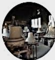
Zvonařská dílna Brodek u Přerova