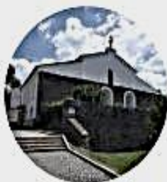
Synagoga Lipník nad Bečvou